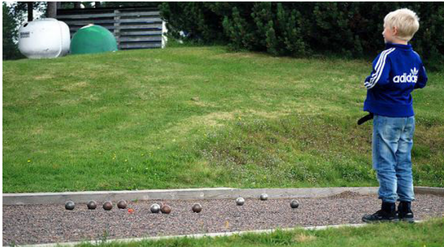
Isak från RMT som boulespelare

Efter frukosten ser många, både ung och gammal, fram emot en rolig och lärorik tipspromenad. Ibland är man ett helt gäng som hjälps åt med frågorna eller också kan man gå själv. Vid kvällsmaten kan man sedan ha chans att vinna fina priser.